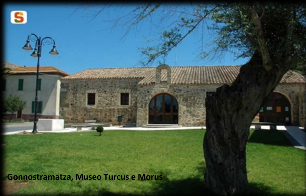
Gonnosramatza, Museo Turcus e Morus

ASSESSORADU DE SOS ENTES LOCALES, FINÀNTZIAS E URBANÌSTICA ASSESSORATO DEGLI ENTI LOCALI, FINANZE ED URBANISTICA Direzione Generale Enti Locali e Finanze Servizio Enti Locali