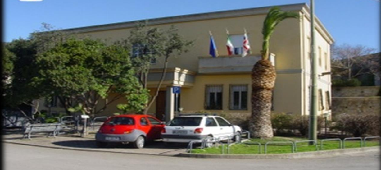
Comune di SINI